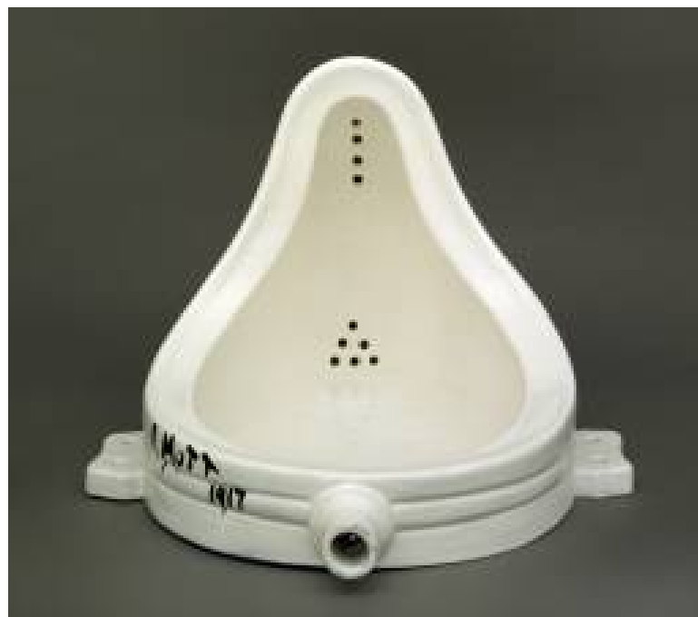
Marcel Duchamp Fountain 1917 (replica 1964)

Tuttavia, se insieme alle opere si salveranno anche le parole (gli scritti, le recensioni, gli studi critici), ci sono buone probabilità che Duchamp continui a essere considerato un grande artista, oppure che venga scambiato per un filosofo o per un sociologo. Comunque sia, i posteri potranno ancora riflettere sui suoi gesti e sulle sue idee. Dovranno almeno riconoscere che la visione dell'arte di Duchamp è stata un importante contributo alla storia del pensiero occidentale.